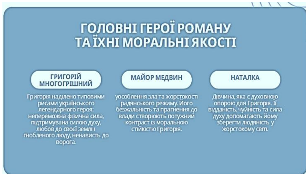
Рисунок 1. Приклади розроблених інфографік здобувачами освіти при виконанні завдань з української літератури