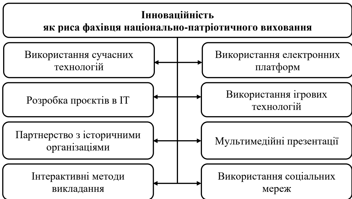
Рис. 5 Інноваційність як риса фахівця національно-патріотичного виховання

Інноваційність фахівця національно-патріотичного виховання визначається його здатністю впроваджувати новаторські та ефективні методи, технології та підходи для залучення здобувачів та досягнення покращених результатів в навчанні та вихованні (Рис. 5).