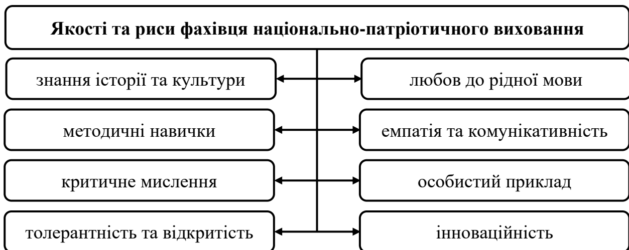
Рис. 1 Сучасні якості фахівця національно-патріотичного виховання

Фахівець національно-патріотичного виховання повинен володіти рядом якостей та рис характеру, що сприяють ефективному впливу на формування національної свідомості та патріотичних цінностей в освітньому процесі: глибокі знання історії та культури, любов до рідної мови, систематичність та методичні навички, емпатія та комунікативність, стимулювання критичного мислення, особистий приклад, толерантність та відкритість, інноваційність тощо (Рис. 1).