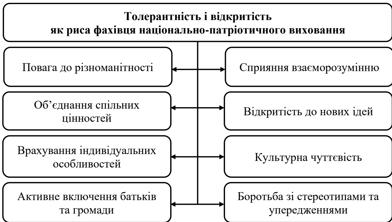
Рис. 4 Толерантність і відкритість як риса фахівця національно-патріотичного виховання

створювати відкрите та позитивне середовище для всіх здобувачів освіти, незалежно від їхньої національної, культурної чи релігійної приналежності (Рис. 4).