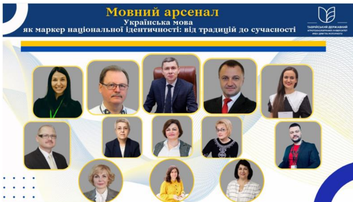
Рис. 2 Команда однодумців, готових до національної єдності

Поважні гості та професійні спікери на подібних заходах мотивують до нових звершень. Заходи Мовного арсеналу підвищили рівень усвідомлення студентами ролі української мови в їхньому особистісному і професійному розвитку, сприяли зміцненню національної ідентичності та розширенню культурних горизонтів учасників. Упровадження інноваційних технологій щодо формування національної ідентичності у даному аспекті ґрунтується на інтеграції сучасних підходів та технологічних рішень у процес виховання, освіти та культурного розвитку з метою зміцнення відчуття національної приналежності та цінностей (Рис. 2).