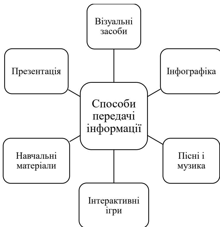
Рис. 2. Способи передачі інформації

Використання візуальних засобів в освіті має довгу історію і включає застосування зображень, слайдів, проєкторів і цифрових технологій. Зображення, такі як картки для запам'ятовування, великі стінові картини та ілюстрації у підручниках, підтримують вивчення нової лексики, граматики і формують мовні, мовленнєві та комунікативні компетентності. Використання проєкторів дозволяє візуалізувати тексти, граматичні вправи і студентські роботи, забезпечують інтерактивність у навчанні через часткове приховування або поетапне відкриття інформації.